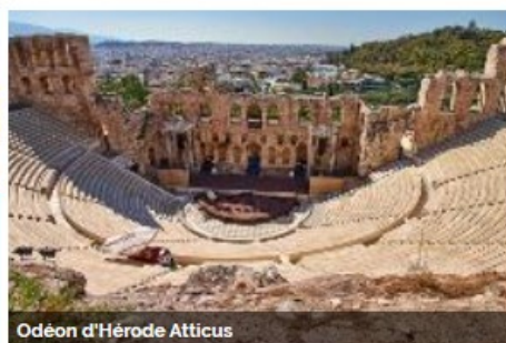
Odéon d'Hérode Atticus