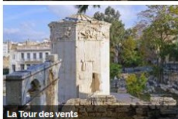
La Tour des vents