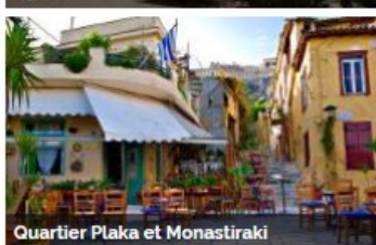
Quartier Plaka et Monastiraki