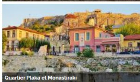
Quartier Plaka et Monastiraki